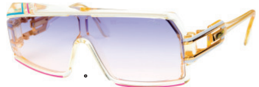
3 Modell 858 col. 255. Ikone der späten 80er: Asymmetrisches Design, bekannt durch MC Hammer, den Film "The Business" usw. Heute hoch gehandelt und von div. Stars wieder entdeckt. Wurde 2006 re-released.